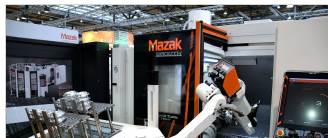
【トピック】工作機械受注が初の1.8兆円へ 日工会、貿易摩擦「大崩れせず」