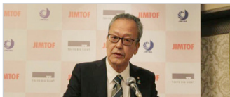
【トピック】日工会、「JIMTOF」来場者15万人目指す 出展機300台、IoTでつなぐ